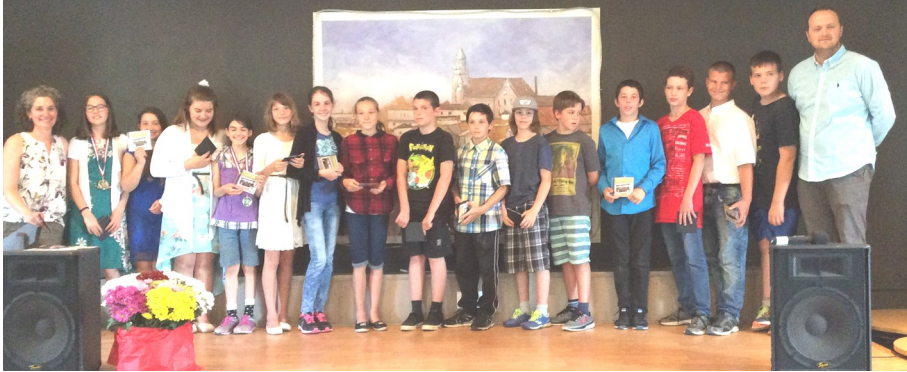
Gala des sourires 2017

Le gala des sourires : 2010 était la première année d'un Gala des Sourires ayant pour but de féliciter les élèves, d'offrir un spectacle de variétés et de célébrer les finissants de l'année.