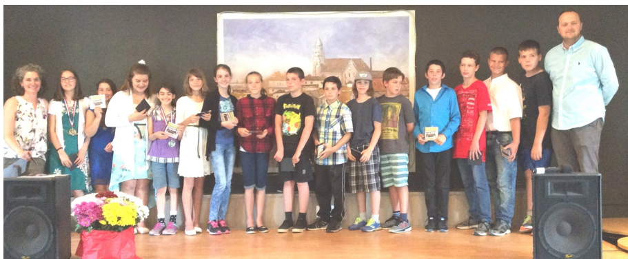
Gala des sourires 2017

Le gala des sourires : 2010 était la première année d'un Gala des Sourires ayant pour but de féliciter les élèves, d'offrir un spectacle de variétés et de célébrer les finissants de l'année.